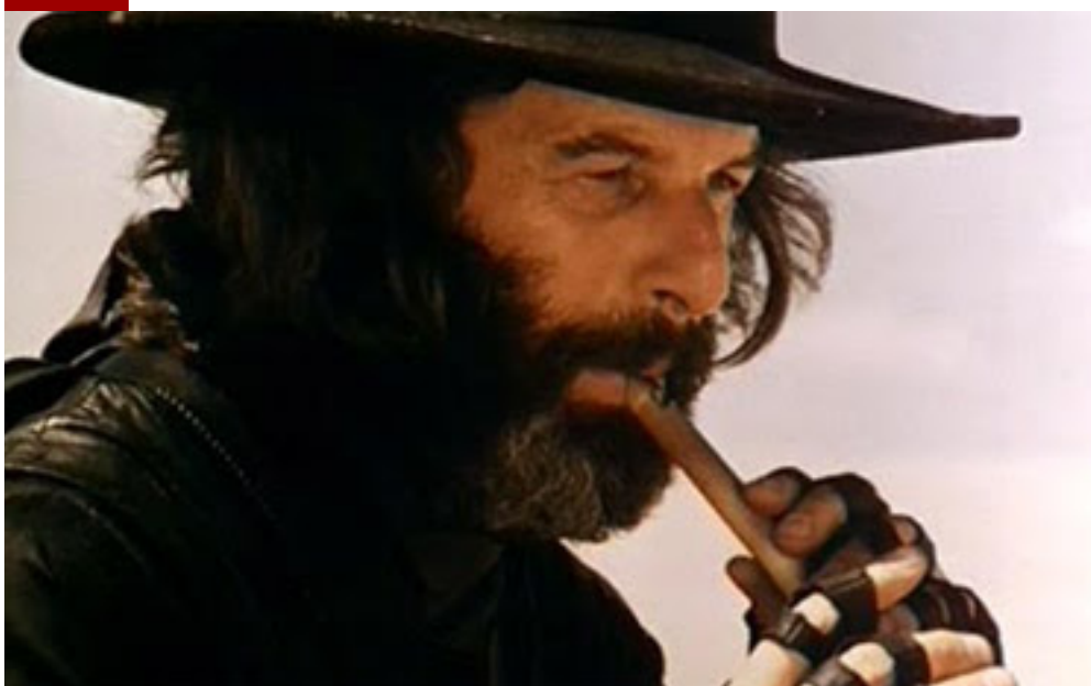
Alejandro Jodorowsky dans El topo , en 1970

Il est évidemment impossible de parcourir en un week-end les soixante ans d'intense activité de cet artiste protéiforme. C'est donc sur le Jodorowsky cinéaste, cousin exacerbé de Buñuel et de Fellini, que l'on se concentrera en ce week-end des 4 & 5 novembre, EN SA PRÉSENCE .